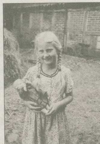
Ein kleines Mädchen der Familie Marxen aus Süderbrarup.