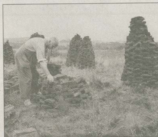
Das Leben in der ersten Hälfte des 20. Jahrhunderts war für viele Menschen mühsam, z. B. beim Torfringeln im Satrupholmer Moor.

Landesamt für Denkmalschutz (Hg.): Theodor Möllers Fotografien 1900-1950. 232 Seiten und zahlreichen Fotos. Wachholtz-Verlag, Neumünster 2007, Preis 29.90 €, ISBN 3-529-02798-7.