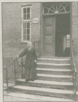
Möller hat per Kamera auch Szenen in Nordschleswig dokumentiert, wie am Schwesternhaus der Herrnhuter Gemeinde.

fen, von Kindern benso wie Greisen. Gerade das Studium dieser Fotos lässt erahnen, dass es Möller bestimmt nicht um eine Verklärung einer »heilen Welt« auf dem Lande gegangen ist, denn sie zeigen auch abgearbeitete Menschen teilweise in Kleidung, die dokumentiert, in welch bescheidenen Verhältnissen die Menschen vor gar nicht so vielen Jahrzehnten im Land zwischen Nord- und Ostsee gelebt haben. Das Buch zeigt auch, wie gedankenlos teilweise ländliche und kleinstädtische Kultur verwüstet worden ist.