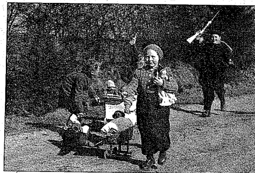
Kinder spielen „Russens überfallen Flüchtlinge“ – um 1954.

Das Buch „Fremdes Zuhause – Flüchtlinge und Vertriebene in Schleswig-Holstein nach 1945“ ist erschienen beim Wachholtz-Verlag. Es hat 256 reich mit Fotos (meist schwarz-weiß) und Skizzen versehene Seiten und enthält eine Film-DVD (46 Minuten Spielzeit). Das Buch kostet 18,90 Euro und ist versandkostenfrei über das Bauernblatt zu beziehen unter: Tel. 04331-1277-822 Fax 04331-1277-833, E-Mail: anzeigen@bauernblattsh.de