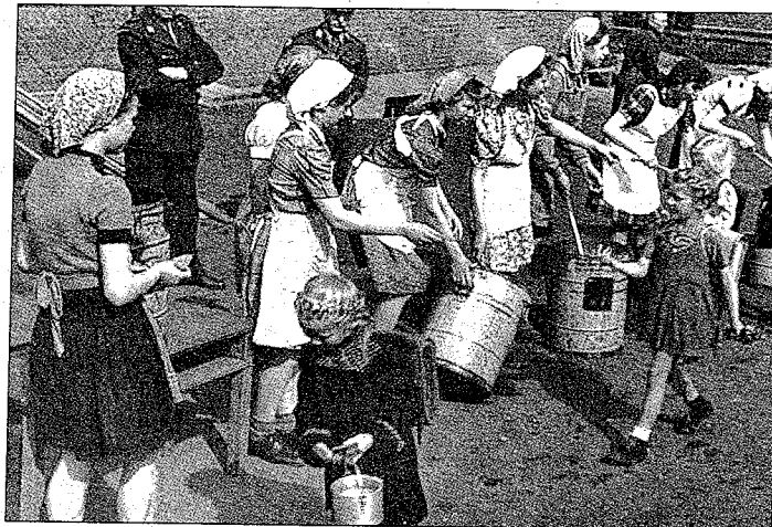
Kinderspeisung in Kiel 1946

Die Neuankömmlinge wurden in Schulen, Kasernen, öffentlichen Räumen, Hotels und Gasthäusern untergebracht oder bei Einheimischen einquartiert. Diese „Übergangslösung“ dauerte für Einige bis in die 1960er Jahre, als die letzten Flüchtlingslager geräumt werden konnten. Viele Flüchtlinge hofften anfangs, nach einigen Monaten in ihre Heimat zu-