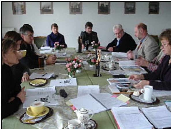
Arbeitskreis-Tagung im Ostener Fährkrug

Drei wichtige maritime Jubiläen in Niedersachsen und Schleswig-Holstein sollen in den beiden kommenden Jahren genutzt werden, die Ferienroute Deutsche Fährstraße Bremervörde - Kiel national und international zu vermarkten: Im Dezember 2008 wird die Schwebefähre über dem Nord-Ostsee-Kanal , die Rendsburg und Osterrönfeld verbindet, 95 Jahre alt. Im Oktober 2009 feiert die Schwebefähre über der Oste zwischen Osten und Hemmoor ihren 100. Geburtstag . Und im selben Jahr wird die Elbfähre zwischen Wischhafen und Glückstadt 90 Jahre alt.