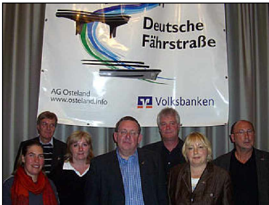
Der Osteland-Vorstand ist erweitert worden