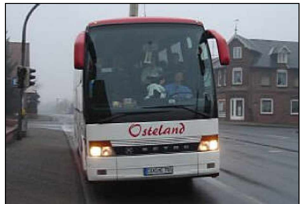
Fahrzeug der Firma Osteland-Busreisen