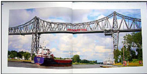
Eindrucksvoll: Großformatige Fotos

Während die Fördergesellschaft zur Erhaltung der Schwebefähre Osten - Hemmoor zur Zeit mit regionalen Verlagen Gespräche über die Herausgabe von Büchern zum 100. Jubiläum im Herbst 2009 führt, ist in Schleswig-Holstein bereits ein einschlägiges Werk erschienen - das erste deutschsprachige Buch über eines der technischen Wunderwerke von einst.