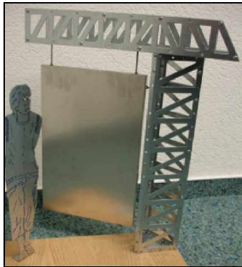
Modell einer Infotafel

Seit längerem wird in Hemmoor über die Idee diskutiert, die dortige Fährstraße mit Schildern in eine Info-Meile zum Thema Welt der Schwebefähren umzuwandeln. Aus Eigeninitiative und Interesse an diesem Projekt hat die Firma Heinz August Bütje ein Modell einer der acht geplanten Tafeln angefertigt, auf denen Informationen zu den acht Schwebefähren der Welt offeriert werden sollen.