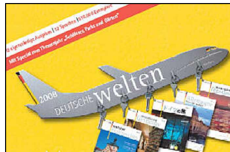
DZT-Veröffentlichung "Deutsche Welten"

Für die Deutsche Fährstraße wird vom Januar an auch in Japan und China geworben. Das hat die Deutsche Zentrale für Tourismus (DZT) der Arbeitsgemeinschaft Osteland mitgeteilt. Über die Deutsche Fährstraße soll auch in der japanischen und chinesischen Ausgabe der DZT-Publikation " Deutsche Welten " berichtet werden, die weltweit gestreut wird und als "Schlüssel zu den internationalen Reisemärkten" gilt.