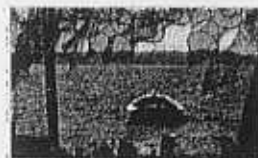
Rund um die Schlei

große Bandbreite der Bildschnitte – von ganz flach und breit bis ganz hoch und schmal – unterstreicht den innovativen Ansatz dieses Buchs. (fju)