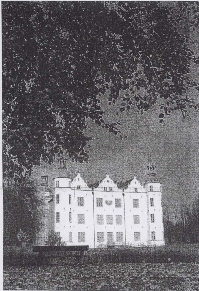
Das Ahrensburger Schloss wurde 1585 von Peter Rantzau errichtet. Von der Mitte des 18. Jahrhunderts bis in die 30er Jahre des 20. Jahrhunderts gehörte es den Grafen Schimmelmann, die das Schloss in wesentlichen Teilen umgestalten ließen. Heute wird die private Stiftung als Museum genutzt.

„Graf Schimmelmann und sein Sohn Ernst sind interessante Persönlichkeiten,