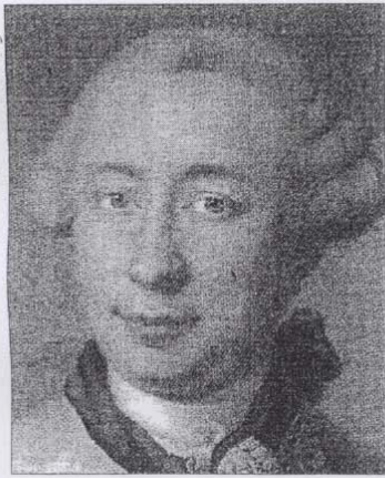
Heinrich Carl Schimmelmann wurde am 13. Juli 1724 in Demmin geboren. Er starb am 16. Februar 1782 in Kopenhagen.