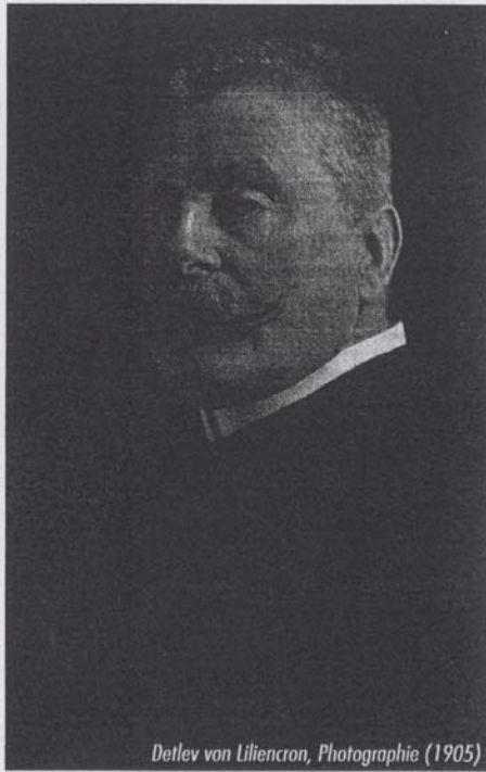
Detlev von Liliencron, Photographie (1905)

Seine Schulden ist er nie ganz losgeworden. Immerhin gewährte ihm Kaiser Wilhelm II. seit 1901 ein jährliches »Ehrengehalt« von zweitausend Mark, was damals eine beträchtliche Summe war. Liliencrons Ruhm kam spät. Rilke, der ihm viel zu verdanken hatte, Hugo von Hofmannsthal, Thomas Mann und Karl Kraus gehörten zu seinen Bewunderern,