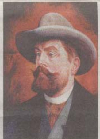
Unterschätzter Dichter: Detlev von Liliencron.