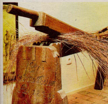
Alte landwirtschaftliche Geräte im Heimatismuseum Hohenwestedt.

Der Museumsführer ist für 12,80 € versandkostenfrei über das Bauernblatt zu beziehen unter: Tel.: 0 43 31-12 77-822 Fax: 0 43 31-12 77-833 E-Mail: anzeigen@bauernblattsh.de