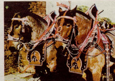
Zugpferde mit traditionellem Geschirr in Lüttau.

Pferde stehen seit Jahrtausenden in unterschiedlichster Beziehung zum Menschen. In Anbetracht der heutigen Aufgaben als Freizeit- oder Sportpferd ist es kaum noch denkbar, welch lebensbestimmende Funktion diese Tiere noch bis vor wenigen Jahrzehnten für die Menschheit erfüllt haben. Ob als Zugpferd für Postkutschen oder als Arbeitspferd in der Maschinierie, die Einsatzbereiche waren vielfältig. Sie werden im Zugferdemuseum in Lüttau im südlichen Kreis Herzogtum Lauenburg anschaulich dargestellt. Dana Heidtmann