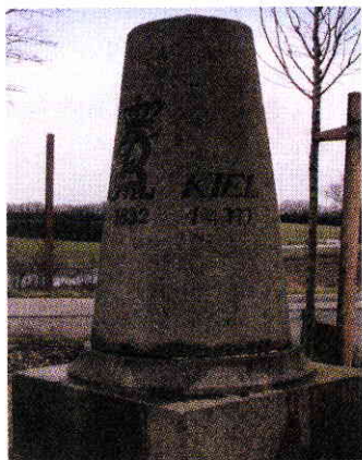
Auch ein Stück Geologie: Granit-Meilenstein der Chaussee Kiel-Altona von 1830.