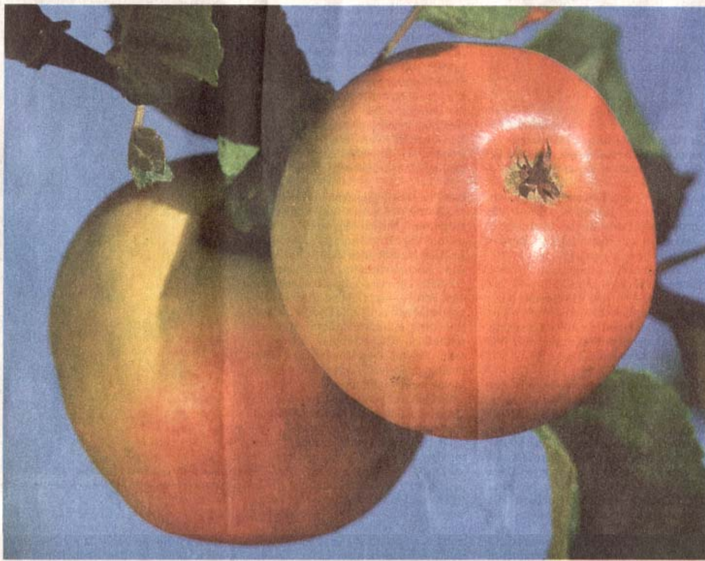
Der „Juwel von Kirchwerder“ wurde erstmals in den 20er-Jahren in den Vierlanden kultiviert.

Er habe versucht, bei der Auswahl der Äpfel, die er im Buch vorstellt, von Hamburg bis zur dänischen Grenze allen Regionen gerecht zu werden, sagt der Pomologe, der es als „großes Dilemma“ empfindet, dass viele nur mehr die großen, bekannten Sorten, die in Super-