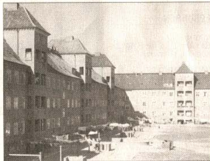
Afrikaviertel, Ansicht Innenhof, um 1945.

■ Zitiert aus: Kiel-Lexikon, herausgegeben von Doris Tillmann und Johannes Rosenplänter, 432 Seiten, 700 Abb., Wachholtz-Verlag, Neumünster 2010, ISBN 978-3-529-02556-3, 432